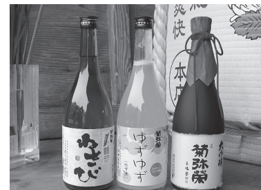
主力のゆずゆずを中心にわさびの焼酎・菊弥栄大吟醸

西部の企業の方は国や県の施策の活用が少なく感じます。販路開拓や設備投資など検討されている方は会議所に相談されるのをお勧めします。