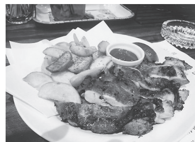
ジャマイカから取り寄せたスパイスを使って作るおすすめジャークチキン

創業に際し、色々と不安はありましたが、商工会議所の支援を受け、本補助金を申請し、活用できたことがオープンへの大きな後押しになりました。様々なシーンで、気軽にご利用ください。