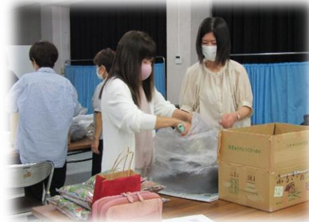
ダンボールコンポストを製作する会員